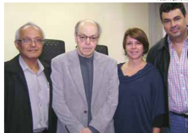
Nova composição da diretoria do MPD.